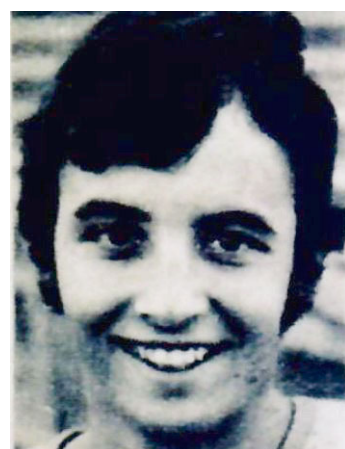
FC La Chaux-de-Fonds (LNA), saison 1970/71.

En bref Né le 25 juillet 1957. FC Saint-Imier: 1968-1984. FC Le Locle (1L-LNB): 1984-1986. FC Saint-Imier: 1986-1990.