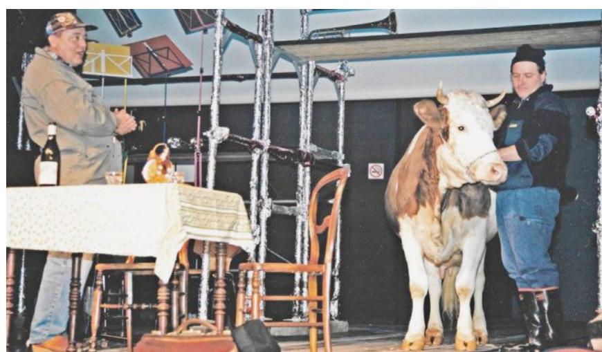
Une vache qui fait ses besoins sur scène, cela n'a rien d'anodin...

Ni une ni deux, de la sciure a été lancée sur scène pour atténuer le problème. Qui était vraiment conséquent, l'urine se déversant par la trappe jusque dans les loges réservées à la troupe imérienne. «Il a fallu réagir, c'était le branle-bas de combat!» Aujourd'hui, toutefois, on en rigole bien. «C'est une des premières grosses péripéties que nous avons connues. Mais il faut avouer que ce bug était finalement cocasse.» Et absolument inoubliable. A part peut-être pour Marguerite. SBI